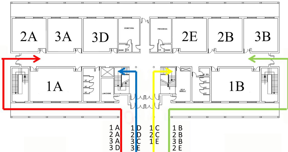
PIANO TERRA ENTRATA

Scuola Secondaria di primo grado "A.Caro" a.s. 2022/2023